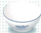
3071B-31 小児汁碗(身) ¥1,210 108φ×50h 250cc