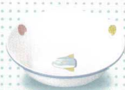
3012-31 フルーツ皿 ¥1,050 122φ×34h 207cc