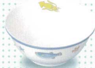
30132-31 ボール・小 ¥1,370 129φ×53h 365cc