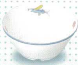
3043-31 反り小鉢 ¥1,140 108φ×46h 210cc