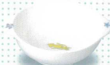
30851-31 キャセロール・小 ¥1,400 124φ×145×43h 260cc