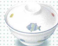
3011-31 小児碗(組) ¥2,090 B(身) ¥1,270 C(蓋) ¥820 129φ×60h(83h) 375cc