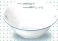
3013-31 ボール・小 ¥1,330 129φ×47h 310cc