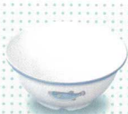
30121-31 ミニボール ¥1,180 122φ×52h 300cc