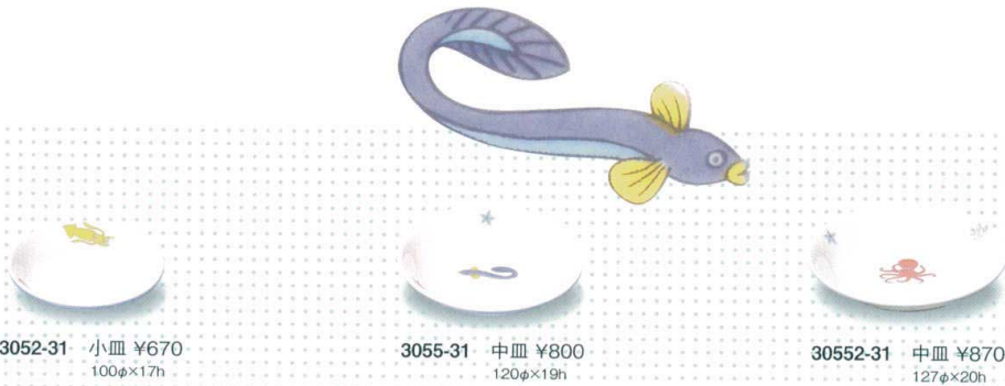
3052-31 小皿 ¥670 100φ×17h