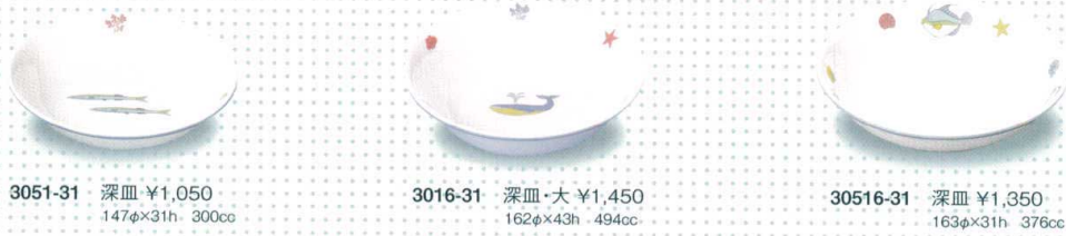
3051-31 深皿 ¥1,050 147φ×31h 300cc