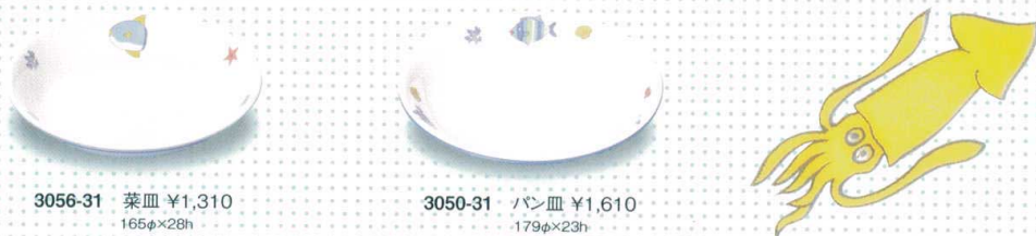
3056-31 菜皿 ¥1,310 165φ×28h