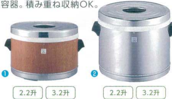
1 2.2升 3.2升 2.2升 3.2升