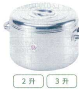
2 升 3 升