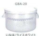
いなほ/ライスホワイト