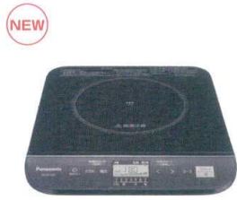
13 パナソニック 業務用IH調理器