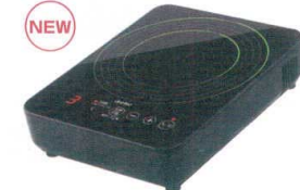
16 ドリテック IHクッカー