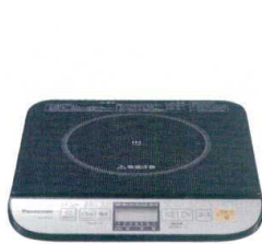
1 パナソニック IH調理器