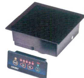
9 IHコンロ DR-1BMA