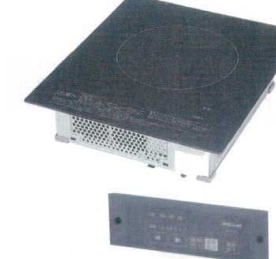
11 パナソニック IH調理器 KZ-F12B