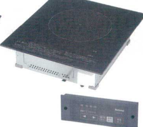
12 パナソニック IH調理器 KZ-F11B