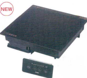
17 IH調理器 DR-18SAA