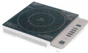
5 シュアア IH調理器