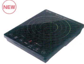
15 ドリテック IHクッカー ラルジュ