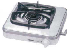
② リンナイ 1口ガスコンロ RTS-1NDB [RHGK-01] △ ㊦