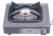
③ パロマ 1口ガスコンロ PA-E18F [RHGK-02] △ ㊦