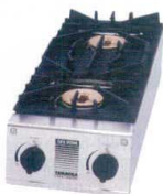
⑫ スペースガッツ SK-5 [EGTK-42] ㊦