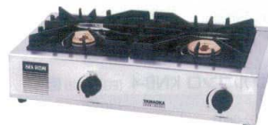
⑬ ガッツNo.2 SK-2 [EGTK-43] ㊦