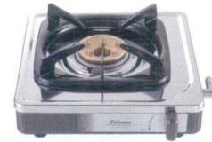
④ パロマ 1口ガスコンロ PA-E18S [RHGK-07] ㊦