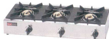
⑩ リンナイ 3口ガステーブル RSB-306SV(立消え安全装置付) [EGTK-18] ㊦