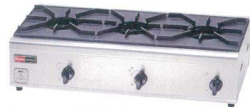
⑦ リンナイ 3口ガステーブル RSB-306N(内炎バーナー) [EGTK-02] ㊦