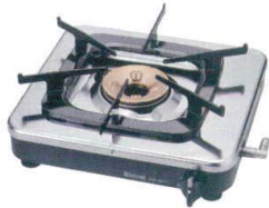
① リンナイ 業務用1口ガスコンロ RSB-150PJ [RHGK-04] △ ㊦