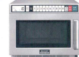
13 シャープ 業務用電子レンジ

RE-7600P [ERNG-23] 12-0306-1301 ¥260,000 サイズ:420×480×H337 庫内寸法:330×330×H175(19ℓ) 電源:単相200V 50/60Hz 消費電力:2,950W プラグ:3極20A250V(コンセントLバー型) レンジ出力:1,900/1,800/1,700/1,600/1,500/1,400/1,300/1,200/1,100/1,000/750/500/250/150/0W相当 15段階切替 重量:20kg ●きめ細かな加熱ができる、7ステップのシリーズ加熱。 ●見やすく操作しやすい、ホワイトバックライトデカ液晶。 ●注文の多いメニューの火加減を記憶する30メモリーキー。