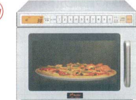
15 ネスター インバーター 業務用電子レンジ

ERN-18TM-2 [ERNG-24] 12-0306-1501 ¥280,000 サイズ:420×535×H335 庫内寸法:330×330×H170(18.5ℓ) 電源:単相200V プラグ:3極/20A/250V/L型 消費電力:2,800W 高周波出力:1,800W~150W相当 10段階切替 重量:20kg ●上下給電方式&新回転アンテナにより、食品の温度ムラを最小限に抑え、大きなお弁当も最適温度に! ●30通りのメモリー機能で誰でも簡単に調理ができます。 ●200VのVFインバーターによる1,800Wの高出力キープでおいしさ、スピードいつも一定! ●高効率・省エネ運転で、電気代が節約できます! ●庫内上下に特殊耐熱結晶化ガラス採用で、ついた汚れはサッと拭くだけで!