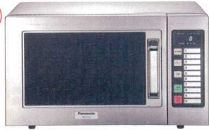
9 パナソニック 業務用電子レンジ

NE-711G [ERNG-28] 50Hz 60Hz 12-0306-0901 12-0306-0902 ¥110,000 サイズ:510×360×H306 庫内寸法:330×330×H200(22ℓ) 電源:単相100V プラグ:並行型15A/125V 消費電力:1,260W 高周波出力:700W/350W/250W相当 3段階切替 重量:18kg ●700W出力で家庭用に比べて1.4倍のスピード。 ●オールステンレスボディ&フラット底面。 ●調理時間・出力を10メモリーまで記憶。 ●コンパクト設計で2段積みOK!