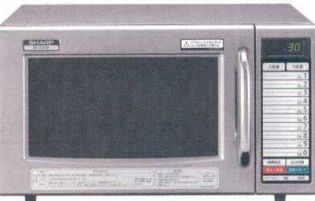
12 シャープ 業務用電子レンジ

RE-3300P [ERNG-32] 12-0306-1201 ¥100,000 サイズ:520×410×H310 庫内寸法:340×360×H200(25ℓ) 電源:単相100V 50/60Hz 消費電力:1,430W 高周波出力:800/700/600/500/200/0W相当 6段階切替 重量:13kg ●きめ細かな加熱ができる、3ステップのシリーズ加熱 ●注文の多いメニューの火加減を記憶、20メモリーキー ●庫内はステンレス製で水に錆びにくく、エアフィルターは洗浄可能な着脱式