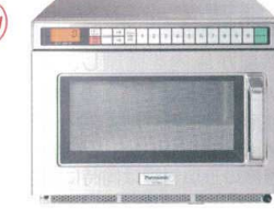
11 パナソニック インバーター

業務用電子レンジ NE-1802 [ERNG-29] 12-0306-1101 ¥260,000 サイズ:422×476×H337 庫内寸法:330×310×H175(18ℓ) 電源:単相200V プラグ:Lバー型20A/250V 消費電力:2,800W 高周波出力:1,800W~150W相当 10段階切替 重量:18kg ●インバーター搭載で高出力1,800W!常に安定した加熱を実現。 ●電源効率をアップ!消費電力を低減。 ●上下からのマイクロ波によりムラを抑えて上手に加熱。 ●食材に合わせて、出力は10段階の選択が可能。 ●フラットな庫内は拭き取りやすくお手入れ簡単。天板の汚れは取り外して丸洗いができます。