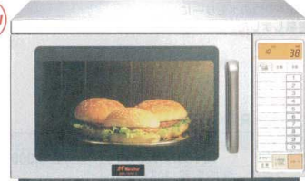
16 ネスター インバーター 業務用電子レンジ

ERN-18YM-2 [ERNG-25] 12-0306-1601 ¥280,000 サイズ:520×438×H307 庫内寸法:330×330×H170(18.5ℓ) 電源:単相200V プラグ:3極/20A/250V/L型 消費電力:2,800W 高周波出力:1,800W~150W相当 10段階切替 重量:20kg ●上下給電方式&新回転アンテナにより、食品の温度ムラを最小限に抑え、大きなお弁当も最適温度に! ●30通りのメモリー機能で誰でも簡単に調理ができます。 ●200VのVFインバーターによる1,800Wの高出力キープでおいしさ、スピードいつも一定! ●高効率・省エネ運転で、電気代が節約できます! ●庫内上下に特殊耐熱結晶化ガラス採用で、ついた汚れはサッと拭くだけで!