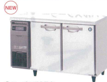
10 テーブル型冷蔵庫