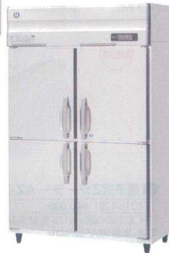
12 業務用冷凍冷蔵庫 HRF-120AT