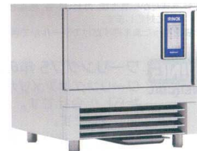
9 イリスノックス マルチフレッシュ MF-30.2T