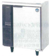
1 テーブル形冷蔵庫