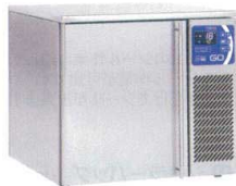
7 卓上型超小型 プラストチラーフリーザー