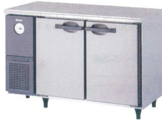
2 コールドテーブル 4261CD-A [IRZK-34] 納 値