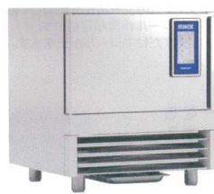
8 イリスノックス マルチフレッシュ MF-25.1T