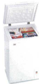
2 ハイアール チェスト式冷凍庫

KF-100NF [ICHF-05] A 値 12-0319-0101 ¥89,000 サイズ:554×554×H845 有効内容量:100ℓ 電源:単相100V 50/60Hz 消費電力:103W 冷却方式:直冷式 重量:31kg ●急速冷凍スイッチ付 ●通電ランプ付