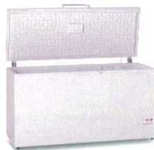
9 エクセレンス 大型チェストフリーザー

JF-MNC429A [ICHF-36] G 12-0319-1301 ¥175,300 サイズ:1,410×745×H910 有効内容量:429ℓ 電源:単相100V 50/60Hz 消費電力:135W 冷却方式:直冷式 重量:67kg ●小物が取り出しやすい「引っ掛けバスケット2個」付。 ●おいしさを逃さない「急冷スイッチ」付。 ●庫内灯、キャスター付。