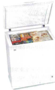
3 ハイアール チェスト式冷凍庫

JF-NC103F(W) [ICHF-21] G 納 12-0319-0201 ¥42,000 サイズ:570×565×H885 有効内容量:103ℓ 電源:単相100V 50/60Hz 消費電力:60W 冷却方式:直冷式 重量:34kg ●小物が取り出しやすい「引っ掛けバスケット」付 ●移動に便利なキャスター付 ●おいしさを逃さない「急冷スイッチ」付