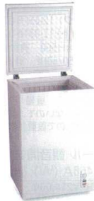
1 エクセレンス ホームフリーザー

KF-100NF [ICHF-05] A 値 12-0319-0101 ¥89,000 サイズ:554×554×H845 有効内容量:100ℓ 電源:単相100V 50/60Hz 消費電力:103W 冷却方式:直冷式 重量:31kg ●急速冷凍スイッチ付 ●通電ランプ付