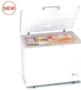
12 ハイアール 上開き式冷凍庫

MV-6282 [ICHF-03] G 納 12-0319-0501 ¥190,000 サイズ:1,020×695×H850 有効内容量:282ℓ 電源:単相100V 50/60Hz 消費電力:110W 冷却方式:直冷式 重量:50kg 付属品:バスケット、霜取りヘラ ●庫内灯、かざ付、急速冷凍スイッチ、温度上昇警告ランプ付、ドレイン付、庫内仕切り板付