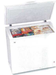
4 ハイアール チェスト式冷凍庫

JF-NC145F(W) [ICHF-20] G 納 12-0319-0301 ¥50,000 サイズ:720×565×H885 有効内容量:145ℓ 電源:単相100V 50/60Hz 消費電力:70W 冷却方式:直冷式 重量:36kg ●小物が取り出しやすい「引っ掛けバスケット」付 ●移動に便利なキャスター付 ●おいしさを逃さない「急冷スイッチ」付