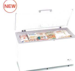
13 ハイアール 上開き式冷凍庫

MV-6362 [ICHF-02] G 納 12-0319-0701 ¥220,000 サイズ:1,260×695×H850 有効内容量:362ℓ 電源:単相100V 50/60Hz 消費電力:130W 冷却方式:直冷式 重量:65kg 付属品:バスケット、霜取りヘラ ●庫内灯、かざ付、急速冷凍スイッチ、温度上昇警告ランプ付、ドレイン付、庫内仕切り板付