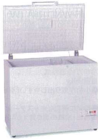
5 エクセレンス 大型チェストフリーザー

JF-NC205F(W) [ICHF-22] G 納 12-0319-0401 ¥80,000 サイズ:940×565×H885 有効内容量:205ℓ 電源:単相100V 50/60Hz 消費電力:78W 冷却方式:直冷式 重量:41kg ●小物が取り出しやすい「引っ掛けバスケット」付 ●移動に便利なキャスター付 ●おいしさを逃さない「急冷スイッチ」付