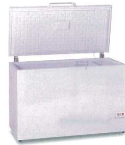
7 エクセレンス 大型チェストフリーザー

JF-MNC319A [ICHF-35] G 納 12-0319-1201 ¥106,000 サイズ:1,055×745×H910 有効内容量:319ℓ 電源:単相100V 50/60Hz 消費電力:95W 冷却方式:直冷式 重量:50kg ●小物が取り出しやすい「引っ掛けバスケット2個」付。 ●おいしさを逃さない「急冷スイッチ」付。 ●庫内灯、キャスター付。