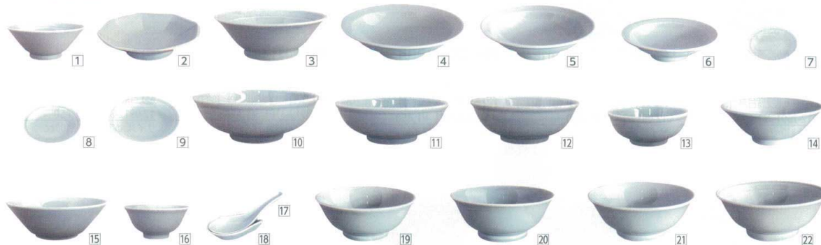
3 青磁 [SMYX-03]