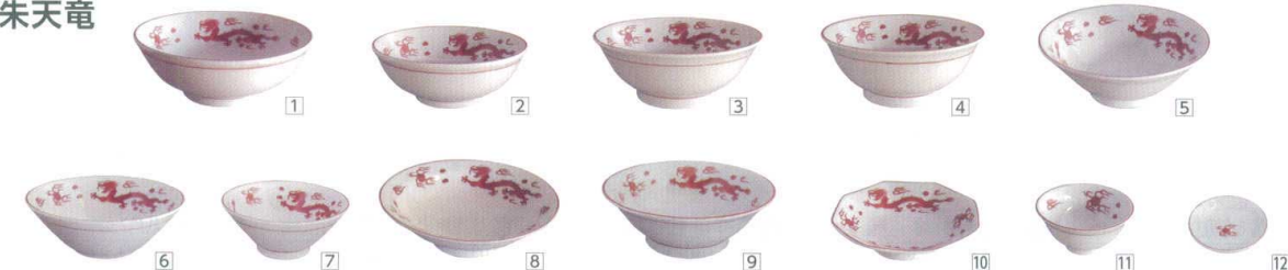
2 朱天竜 [SMYX-02]