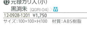
⑫ 元禄ガリ入(小) 黒測朱 [QGRI-04] W 12-0928-1201 ¥1,750 サイズ:100×100×H100 材質:ABS樹脂