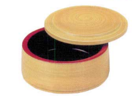
③ (若)DX富士型ちらし桶 白木 [RSSO-10] W 12-0928-0301 ¥1,650 サイズ:φ160×H85 材質:ABS樹脂