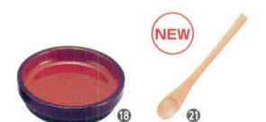
⑱ (若)DXタレ入れ 朱天黒 [RTRI-15] W 12-0928-1801 ¥480 サイズ:φ94×H24 材質:ABS樹脂