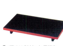
⑦ (福)DX盛付台 大 黒測朱 [RMOD-07] W 12-0928-0701 ¥2,100 サイズ:273×167×H37 材質:ABS樹脂