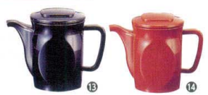
⑬ (若)ショーユ差し 黒 [QSYS-02] W 12-0928-1301 ¥2,200 サイズ:115×62×H90 材質:アクリル樹脂