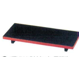
⑧ (福)DX盛付台 小 黒測朱 [RMOD-08] W 12-0928-0801 ¥2,000 サイズ:273×121×H33 材質:ABS樹脂