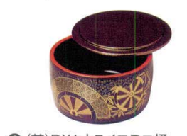
⑥ (若)DX4寸タイコミニ桶 梨地御所車内黒塗 [RSSO-16] W 洗 サイズ 本体(深型)φ117×H63 12-0928-0601 ¥850 蓋 φ117×H12 12-0928-0602 ¥600 材質:耐熱ABS樹脂