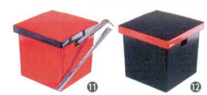
⑪ 元禄ガリ入(小) 朱測黒 [QGRI-03] W 12-0928-1101 ¥1,750 サイズ:100×100×H100 材質:ABS樹脂 ※トングは別売りです。