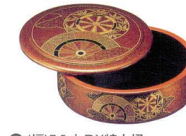
⑤ (福)7.5寸 DX特上桶 梨地御所車 [RSSO-15] W サイズ 本体 φ228×H63 12-0928-0501 ¥2,350 蓋 φ224×H21 12-0928-0502 ¥1,900 材質:ABS樹脂