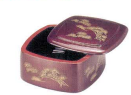
④ (若)DX角ちらし桶 溜パール老松 [RSSO-06] W 12-0928-0401 ¥2,050 サイズ:150×150×H85 材質:ABS樹脂