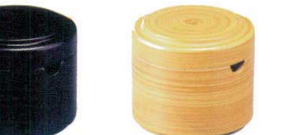
白木 12-0928-1503 ¥1,550