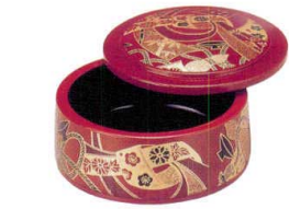
② (若)DX富士型ちらし桶 朱に結び [RSSO-09] W 12-0928-0201 ¥1,700 サイズ:φ160×H85 材質:ABS樹脂