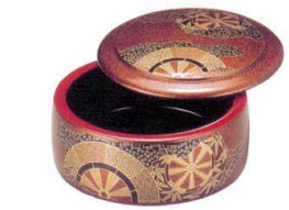
① (若)DXタイコちらし桶 金梨地御所車 [RSSO-04] W 12-0928-0101 ¥2,400 サイズ:φ160×H90 材質:ABS樹脂