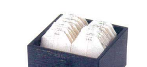
⑳ (福)足付ティーパック入れ 黒 [RCHI-02] W 12-0928-2001 ¥1,600 サイズ:90×95×H65