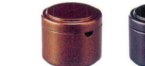
⑮ (福)つつ型粉茶入れ [RCHI-01] W 梨地 12-0928-1501 ¥1,400 黒乾漆 12-0928-1502 ¥1,500 サイズ:φ70×H60 材質:熱硬化特殊樹脂