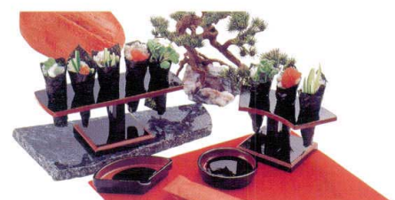
⑨ (若)手巻きすし立て 3本用 黒測朱 [RSUT-01] W 12-0928-0901 ¥1,350 サイズ:178×80×H83 材質:ABS樹脂