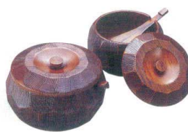
16 (若)いずみ飯器 溜 [SSMS-25] W 画 6 サイズ 1人用(ヘラなし) φ150×H 70 12-0939-1601 ¥1,450 2人用(ヘラ付) φ180×H100 12-0939-1602 ¥2,570 3人用(ヘラ付) φ223×H125 12-0939-1603 ¥3,450 5人用(ヘラ付) φ270×H135 12-0939-1604 ¥4,750 10人用(ヘラ付) φ322×H170 12-0939-1605 ¥7,800 材質:ABS樹脂