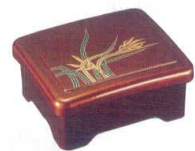
5 (福)光月井重 梨地蘭 内朱 [RDNJ-08] W 画 6 12-0939-0501 ¥1,700 サイズ:167×143×H80 内寸:143×119×H46 材質:ABS樹脂