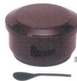
18 (若)いずみ飯器 根来 [SSMS-26] W 画 6 サイズ 1人用(ヘラなし) φ150×H 70 12-0939-1801 ¥1,500 2人用(ヘラ付) φ180×H100 12-0939-1802 ¥2,720 3人用(ヘラ付) φ223×H125 12-0939-1803 ¥3,700 5人用(ヘラ付) φ270×H135 12-0939-1804 ¥4,900 10人用(ヘラ付) φ322×H170 12-0939-1805 ¥7,850 材質:ABS樹脂