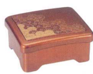
2 (福)光月井重 梨地野菊 内朱 [RDNJ-05] W 画 6 12-0939-0201 ¥1,750 サイズ:167×143×H80 内寸:143×119×H46 材質:ABS樹脂