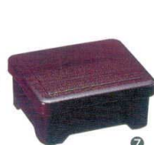
7 (福)耐熱木目井重 溜内朱 [RDNJ-10] W 画 6 12-0939-0701 ¥1,850 サイズ:168×143×H72 内寸:148×123×H47 材質:耐熱ABS樹脂