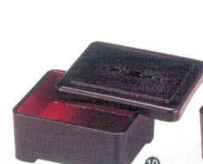
10 (若)耐熱井重 新木目 黒内朱塗 [RDNJ-03] W 画 6 12-0939-1001 ¥1,750 サイズ:168×143×H78 材質:耐熱ABS樹脂