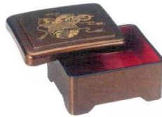
3 (福)光月井重 梨地 内朱 [RDNJ-06] W 画 6 12-0939-0301 ¥1,800 サイズ:167×143×H80 内寸:143×119×H46 材質:ABS樹脂