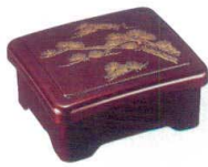
1 (福)光月井重 溜パール松 内朱 [RDNJ-04] W 画 6 12-0939-0101 ¥1,650 サイズ:167×143×H80 内寸:143×119×H46 材質:ABS樹脂