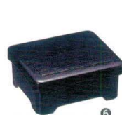
6 (福)耐熱木目井重 黒内朱 [RDNJ-09] W 画 6 12-0939-0601 ¥1,750 サイズ:168×143×H72 内寸:148×123×H47 材質:耐熱ABS樹脂