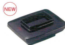
19 (福)福うなぎ平 曙内朱 [RDNJ-15] W 画 6 12-0939-1901 ¥2,350 サイズ:166×130×H65 材質:ABS樹脂