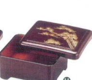
11 (若)象足井重 溜老松内朱塗 (フタのみ柄入) [RDNJ-02] W 画 6 12-0939-1101 ¥1,650 サイズ:168×143×H76 材質:ABS樹脂