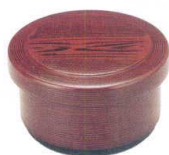
17 (若)保温飯器 木目 (ヘラ付) [SSMS-06] W 画 6 サイズ 2人用 φ225×H130 12-0939-1701 ¥5,150 3人用 φ252×H140 12-0939-1702 ¥5,850 5人用 φ280×H157 12-0939-1703 ¥7,300 材質:ABS樹脂 ●オヤ・フタとも発泡ウレタン注入により約1.5時間 さめませんので、ごはんがいつまでも温かく召し 上がれます。