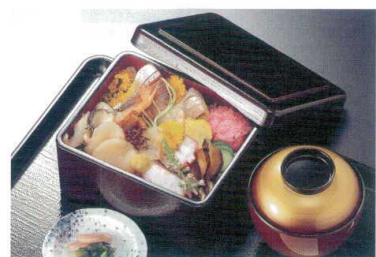
14 摺り漆 木製飯器セット [SHNK-01] 画 6 サイズ 大 25782 φ175×H95 12-0939-1401 ¥9,500 中 25892 φ140×H95 12-0939-1402 ¥6,200 ●しゃもじ付