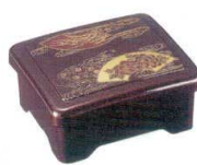
4 (福)光月井重 扇面菊水 内朱 [RDNJ-07] W 画 6 12-0939-0401 ¥1,850 サイズ:167×143×H80 内寸:143×119×H46 材質:ABS樹脂