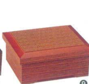
9 (福)源氏井重 春慶千筋内朱 [RDNJ-12] W 画 6 12-0939-0901 ¥2,550 サイズ:173×143×H80 内寸:150×120×H44 材質:ABS樹脂