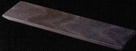
3-010-01 1203858 【木】レアウッドスリムレクタングルプレート ブラックウッド ¥39,000 340×90×H18 梱25