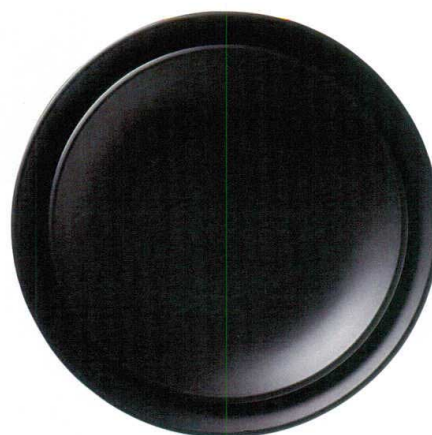
[A]サークルプレート 総墨黒