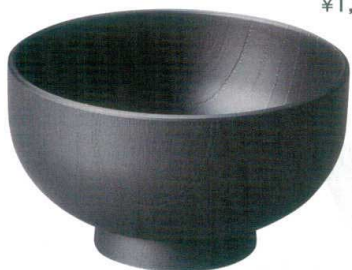
3-153-04 1001160 【TA】耐熱3.8寸木目汁椀 総墨黒 ¥1,200 φ116×H70 梱300