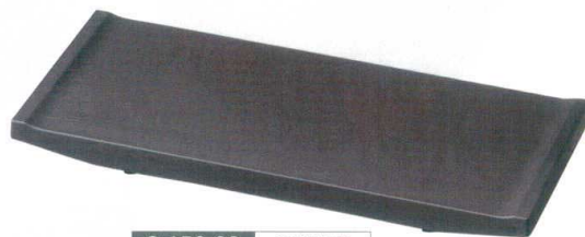
3-153-02 1202847 【A】9寸豊洲盛台 総墨黒 ¥1,900 270×120×H28 梱80