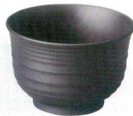
3-153-05 1001161 【PBT】耐熱3.7寸段付木目汁椀 総墨黒 ¥750 φ110×H74 梱300