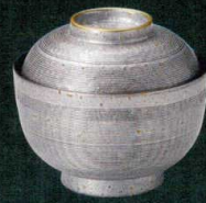
3-160-03 1001246 【TA】耐熱3.4寸干筋小吸椀 鉄錆内黒 ¥4,000 φ102×H90(H65) 梱200