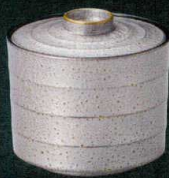
3-160-01 1001244 【TA】耐熱(小)美里段付飯器 鉄錆内黒 ¥4,200 96φ×H90(H78) 梱100