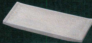
3-160-10 1203298 【A】9寸豊洲盛台 鉄錆 ¥5,500 270×120×H28 梱80