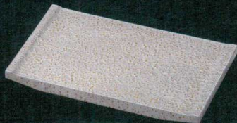
3-160-09 1203297 【A】8寸豊洲盛台 鉄錆 ¥5,400 240×150×H24 梱80