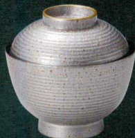
3-160-05 1001248 【TA】耐熱3.6寸小丸干筋小吸椀 鉄錆内黒 ¥4,300 107φ×H97(H72) 梱100