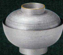
3-160-06 1001249 【A】4寸干筋ケヤキ吸椀 鉄錆内黒 ¥4,000 φ121×H9(H61) 梱100