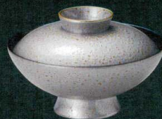
3-160-07 1001250 【A】4.5寸小槌吸椀 鉄錆内黒 ¥4,500 φ130×H87(H58) 梱100