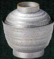
3-160-02 1001245 【TA】耐熱3.5寸乱筋椀 鉄錆内黒 ¥3,900 φ101×H101(H70) 梱100