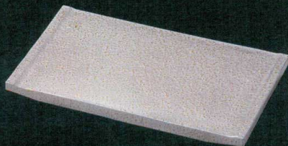
3-160-11 1203299 【A】尺0寸豊洲盛台 鉄錆 ¥6,400 300×180×H32 梱40