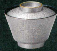
3-160-04 1001247 【TA】耐熱3.3寸布目小吸椀 鉄錆内黒 ¥3,900 104φ×H85(H70) 梱100