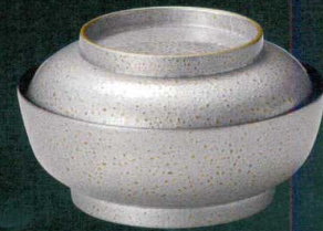
3-160-08 1001251 【TA】耐熱5.4寸平煮物椀 鉄錆内黒 ¥5,600 163φ×H92(H63) 梱60