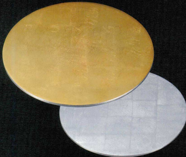
3-168-05 1101706 【木】丸両面敷膳 金箔/銀箔 6寸 ¥4,200 φ190×H5 梱20