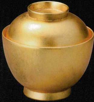
3-168-01 1001231 【木質】耐熱3.2寸玉子椀 総本金箔貼り ¥52,000 φ104×104(H72) 梱100