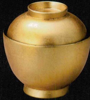
3-168-02 1001232 【木質】耐熱3.2寸玉子椀 本金箔貼り内黒塗 ¥34,000 φ104×104(H72) 梱100