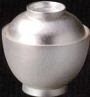
3-170-01 1001237 【木質】耐熱3.2寸玉子椀 総本銀箔貼り ¥42,000 φ104×104(H72) 楕100