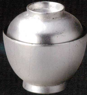
3-170-02 1001238 【木質】耐熱3.2寸玉子椀 本銀箔貼り内黒塗 ¥26,000 φ104×104(H72) 楕100