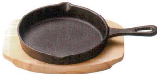
3-178-01 1600943 【鉄・木】持ち手付きステーキ皿セット 小 ¥3,800 個12