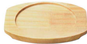
3-178-06 1600948 【木】持ち手付きステーキ皿用敷板 中 ¥2,100 190×149×H15 個24