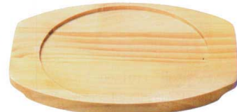
3-178-09 1600951 【木】持ち手付きステーキ皿用敷板 大 ¥2,800 249×196×H15 個24