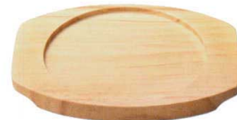
3-178-03 1600945 【木】持ち手付きステーキ皿用敷板 小 ¥1,900 179×138×H16 個24