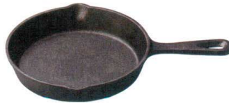
3-178-05 1600947 【鉄】持ち手付きステーキ皿 中 ¥2,900 φ155×243×H30 個12