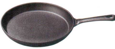
3-178-08 1600950 【鉄】持ち手付きステーキ皿 大 ¥3,100 φ198×312×H25 個12