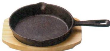
3-178-04 1600946 【鉄・木】持ち手付きステーキ皿セット 中 ¥4,500 個12