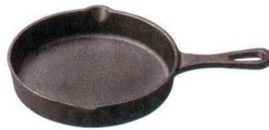
3-178-02 1600944 【鉄】持ち手付きステーキ皿 小 ¥2,400 φ135×257×H25 個12