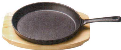
3-178-07 1600949 【鉄・木】持ち手付きステーキ皿セット 大 ¥5,400 個12