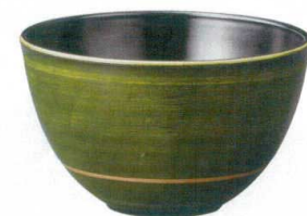
3-205-07 1001429 【TA】耐熱フィットボール(S) 緑レトロ金ライン内黒 ¥1,600 φ113×H68 楕100