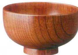
3-205-02 1001413 【木】木製3.8寸汁椀 摺り漆 ¥1,700 φ115×H69 楕144