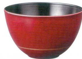
3-205-06 1001428 【TA】耐熱フィットボール(S) 赤レトロ金ライン内黒 ¥1,600 φ113×H68 楕100