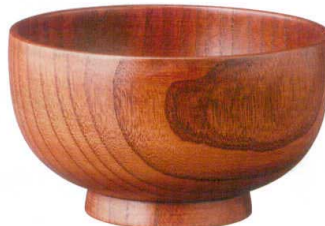
3-205-04 1001415 【木】木製4.8寸多用丼 摺り漆 ¥2,700 φ144×H83 楕120