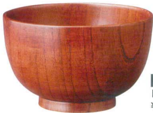
3-205-03 1001414 【木】木製4.3寸小丼 摺り漆 ¥2,500 φ128×H84 楕120