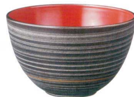
3-205-05 1001427 【TA】耐熱フィットボール(S) レトロブラック帯金内朱 ¥1,600 φ113×H68 楕100