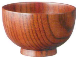
3-205-01 1001412 【木】木製3.5寸汁椀 摺り漆 ¥1,600 φ105×H67 楕144

[TA] [木質] [PET] [PBT] [PC] [TR] [メラミン] [CE] マークは 洗浄機対応