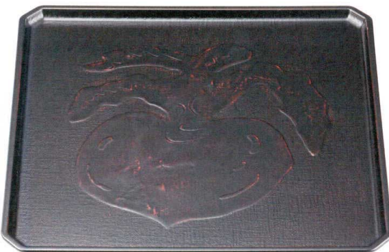
3-302-05 1101959 【A】尺1.5寸角隅切布目盆 かぶら曙裏黒乾漆塗 ¥8,500 345×345×H17 楕40