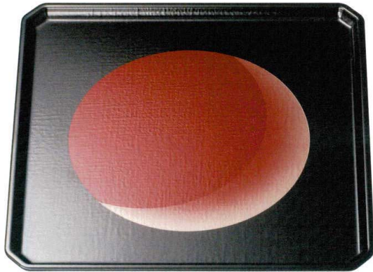
3-302-01 1101955 【A】尺1.5寸角隅切布目盆 おぼろ紅月光裏黒乾漆塗 ¥11,800 345×345×H17 楕40