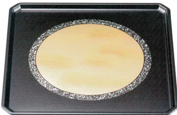
3-302-03 1101957 【A】尺1.5寸角隅切布目盆 おぼろ金雲海銀環裏黒乾漆塗 ¥10,200 345×345×H17 楕40