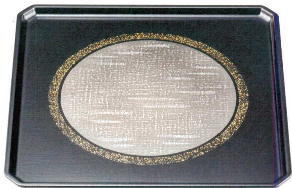
3-302-04 1101958 【A】尺1.5寸角隅切布目盆 おぼろ銀地金環裏黒乾漆塗 ¥10,200 345×345×H17 楕40