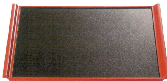
[A] 松平長手盆 溜