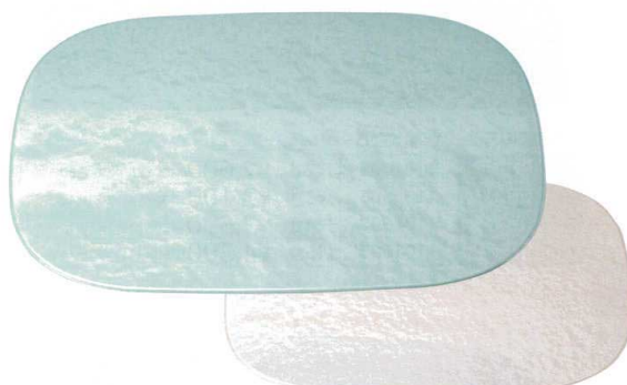
[A] かつわ両面敷膳 グリーン雲流/ペーシェ雲流