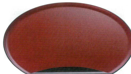
[A] 加賀布目半月盆 朱かすり天黒