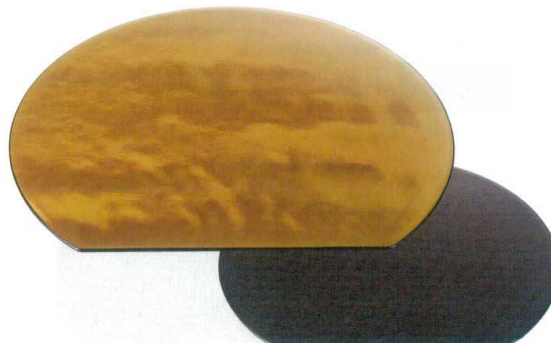
[A] 半月両面敷膳 金瑞雲/黒乾漆