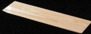
3-036-01 1203872 【木】ウッディーコーキングスリムプレート ホワイトコーキング ¥50,000 340×90×H15 梱40