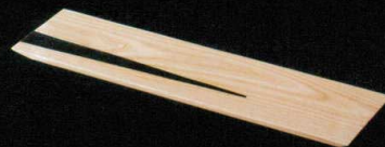
3-036-02 1203873 【木】ウッディーコーキングスリムプレート ブラックコーキング ¥50,000 340×90×H15 梱40