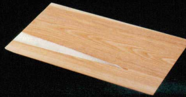
3-036-03 1203874 【木】ウッディーコーキングレクタングルプレート ホワイトコーキング ¥55,000 270×160×H15 梱30