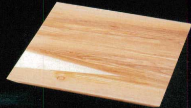
3-036-05 1203876 【木】ウッディーコーキングスクウェアプレート ホワイトコーキング ¥63,000 270×270×H15 梱20