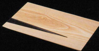
3-036-04 1203875 【木】ウッディーコーキングレクタングルプレート ブラックコーキング ¥55,000 270×160×H15 梱30