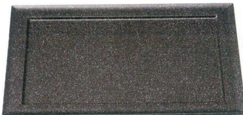
3-363-05 1100969 [A]尺0寸長手京懐石盆 黒に銀石目 ¥2,650 302×217×H12 梱60