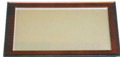
3-363-02 1100966 [A]尺0寸長手京懐石盆 銀透き淵白檀裏黒塗 ¥6,200 302×217×H12 梱60