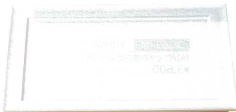
3-363-03 1100967 [A]尺0寸長手京懐石盆 ホワイトアクリア測金 ¥2,950 302×217×H12 梱60