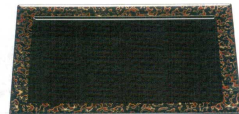
3-363-06 1100970 [A]尺0寸長手京懐石盆 黒淵堆朱 ¥3,600 302×217×H12 梱60