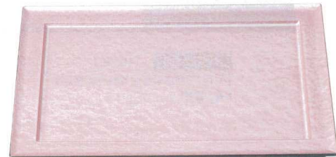
3-363-04 1100968 [A]尺0寸長手京懐石盆 ピンク雲流 ¥2,950 302×217×H12 梱60