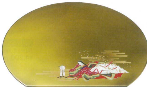
3-371-05 1101018 【A】尺3寸半月敷膳 平安美人 ¥6,500 391×345×H5 梱40