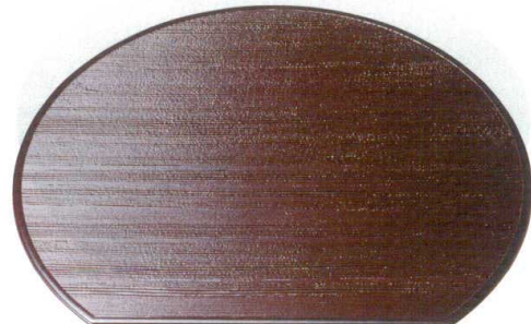
3-371-07 1101020 【A】尺2寸ヘギ目半月敷膳 つや消し溜 ¥1,900 360×317×H4 梱50