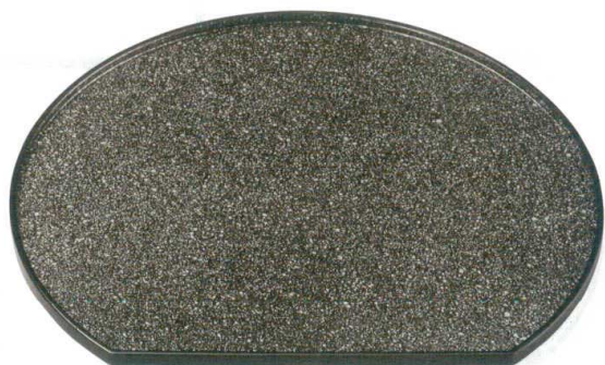
[A] 切立半月盆 黒に銀石目