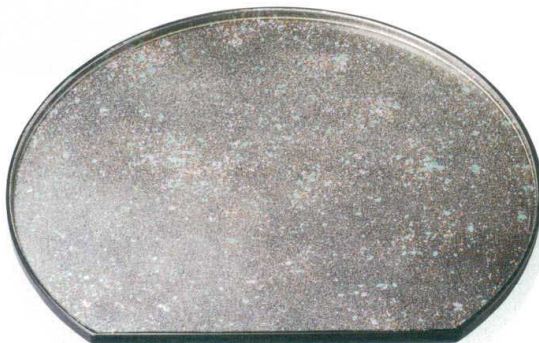
[A] 切立半月盆 銀箔ちらし測黒