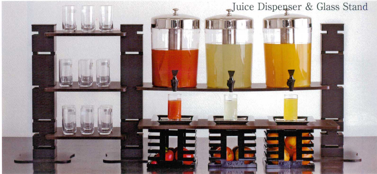
Juice Dispenser & Glass Stand