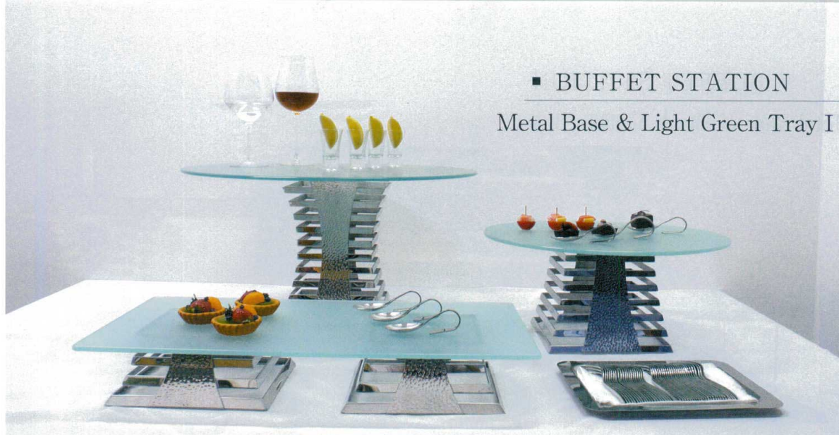
■ BUFFET STATION Metal Base & Light Green Tray I