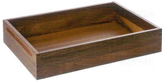
3-417-02 1201207 【木】ウッドボックス ¥128,000 530×370×H100 梱4