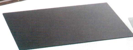
3-417-07 1201212 【ガラス】特殊強化ブラックガラス ¥54,000 500×340×H4 梱1