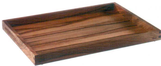
3-417-01 1201206 【木】トレーソリッド ¥98,000 530×370×H40 梱5