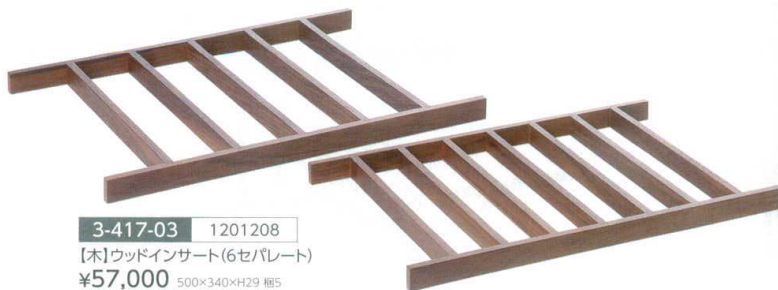
3-417-03 1201208 【木】ウッドインサート(6セパレート) ¥57,000 500×340×H29 梱5