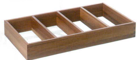
3-417-05 1201210 【木】ウッドインサート(4セパレート) ¥74,000 500×270×H70 梱4