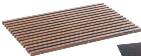
3-417-06 1201211 【木】ウッドグリッド ¥58,000 498×338×H20 梱5