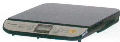
3-421-02 1203945 【ステンレス】IH調理器 (Panasonic) インダクションヒーター ¥51,000 304×345×H54 個1