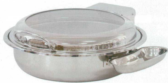
3-421-01 1203944 【ステンレス】丸チューフィンデッシュ(フィリップ) ¥79,000 φ420×465×H165 個1

ゲストの動きを見ながら料理の補充。 料理の盛り付けは少なめに心がけ、 こまめに料理を補充する気配りはゲストに 作りたてのおいしさで味わっていただけます。 食べ頃の時間がすぎてしまい冷たくなったり 乾燥してしまった料理は新しいものと 取り替えるサービスも大切です。