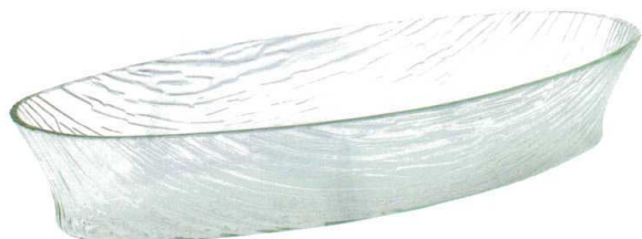
3-427-06 1201272 【AC】小型buffeetaブ(アクリル製) ¥18,500 487×202×H90 梱1