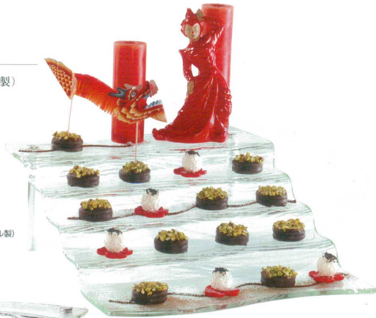
3-427-01 1201266 【AC】5ステップスタンド(L)(アクリル製) ¥50,000 417×530×H160 梱1