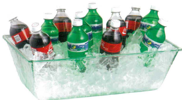
3-427-05 1201271 【AC】長角buffeetaブ(アクリル製) ¥52,000 530×325×H152 梱1