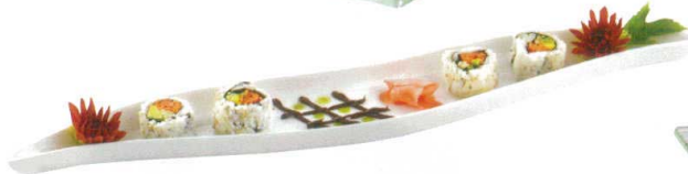
3-427-03 1201269 【陶】アパタイザートレイ(B)(陶磁器) ¥8,600 530×H80 梱1