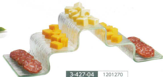
3-427-04 1201270 【AC】5ステップライザー(S)(アクリル製) ¥9,000 380×150×H100 梱1