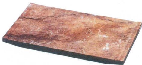
3-045-05 1204292 [A]尺0寸豊洲盛台 ブラウンストーン洩黒 ¥5,000 300×180×H32 梱40