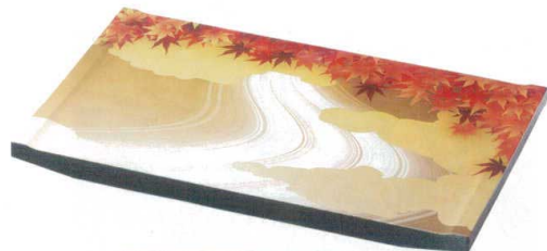
3-045-03 1204290 [A]尺0寸豊洲盛台 紅葉流水洩黒 ¥5,000 300×180×H32 梱40