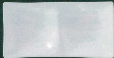
3-461-03 1201535 【A】ツープレート 白 ¥1,100 167×85×H29 梱200