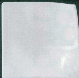
3-461-02 1201534 【A】ワンプレート 白(M) ¥800 111×111×H46 梱200