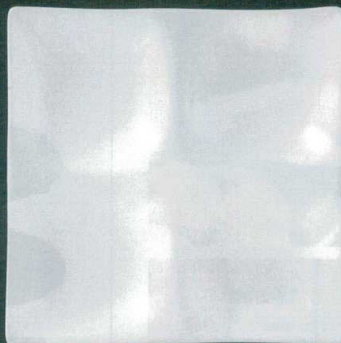
3-461-05 1201537 【A】フォープレート 白 ¥1,800 172×172×H28 梱150