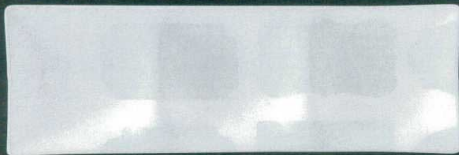
3-461-04 1201536 【A】スリープレート 白 ¥1,500 262×85×H29 梱150