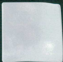
3-461-01 1201533 【A】ワンプレート 白(S) ¥700 86×86×H43 梱200