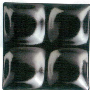
3-471-05 1201628 【A】フォープレート 黒石目 ¥1,550 172×172×H28 櫃150