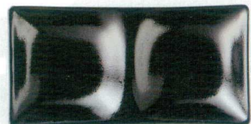
3-471-03 1201626 【A】ツープレート 黒石目 ¥1,000 167×85×H29 櫃200