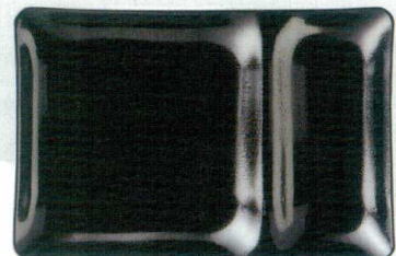
3-471-06 1201629 【A】ワンセットプレート 黒石目 ¥1,800 255×170×H25 櫃100