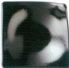
3-471-02 1201625 【A】ワンプレート 黒石目(M) ¥800 111×111×H46 櫃200