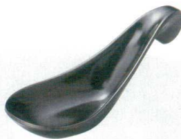
3-481-17 1201803 【メラミン】耐熱フックレンゲ珍味 黒 ¥260 121×48×H43 極400