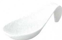
3-481-01 1201787 【TA】耐熱立ちレンゲ珍味 白 ¥550 119×48×H34 極400