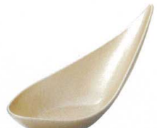
3-481-10 1201796 【TA】耐熱しずく珍味 シャンパンゴールド ¥800 125×53×H71 極400