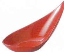
3-481-08 1201794 【TA】耐熱しずく珍味 本朱 ¥550 125×53×H71 極400