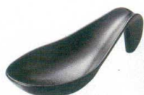
3-481-02 1201788 【TA】耐熱立ちレンゲ珍味 黒石目 ¥750 119×48×H34 極400