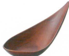
3-481-09 1201795 【TA】耐熱しずく珍味 チーク刷毛目 ¥1,100 125×53×H71 極400