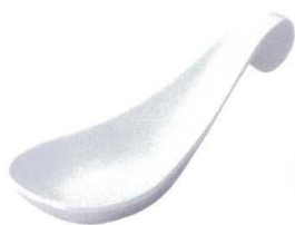
3-481-16 1201802 【メラミン】耐熱フックレンゲ珍味 白 ¥260 121×48×H43 極400