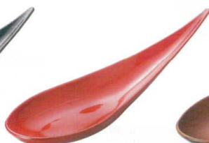
3-481-13 1201799 【TA】耐熱スリムしずく珍味 本朱 ¥550 156×49×H47 極400