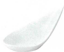
3-481-06 1201792 【TA】耐熱しずく珍味 白 ¥550 125×53×H71 極400