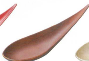
3-481-14 1201800 【TA】耐熱スリムしずく珍味 チーク刷毛目 ¥1,100 156×49×H47 極400