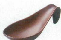
3-481-04 1201790 【TA】耐熱立ちレンゲ珍味 チーク刷毛目 ¥1,100 119×48×H34 極400