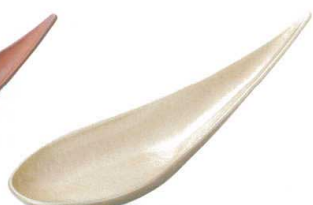
3-481-15 1201801 【TA】耐熱スリムしずく珍味 シャンパンゴールド ¥800 156×49×H47 極400