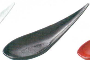
3-481-12 1201798 【TA】耐熱スリムしずく珍味 黒石目 ¥750 156×49×H47 極400