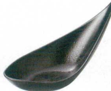
3-481-07 1201793 【TA】耐熱しずく珍味 黒石目 ¥750 125×53×H71 極400