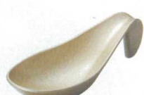
3-481-05 1201791 【TA】耐熱立ちレンゲ珍味 シャンパンゴールド ¥800 119×48×H34 極400