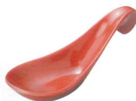
3-481-18 1201804 【メラミン】耐熱フックレンゲ珍味 朱 ¥260 121×48×H43 極400