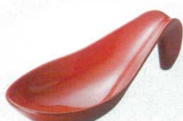
3-481-03 1201789 【TA】耐熱立ちレンゲ珍味 本朱 ¥550 119×48×H34 極400