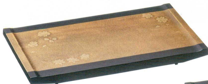
3-517-01 1204052 【A】尺0寸豊洲盛台 春秋みなも金彩裏黒乾漆塗 ¥6,900 300×180×H32 梱40