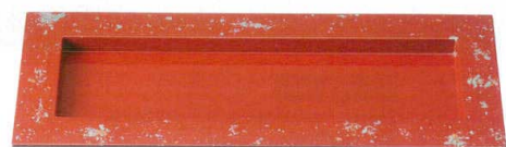
3-553-04 1200040 【A】尺1寸つば付長角皿 本朱洳箔ちらし ¥4,000 328×136×H20 幅100