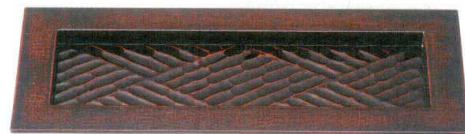
3-553-06 1200042 【A】尺1寸カンナ目つば付長角皿 曙 ¥1,750 328×136×H20 幅100