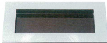
3-553-01 1200037 【A】8寸つば付長角皿 溜洳銀 ¥1,350 230×135×H20 幅100