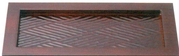
3-553-07 1200067 【A】尺2.5寸つば付長角皿 栴裏黒塗 ¥2,350 380×200×H21 幅60