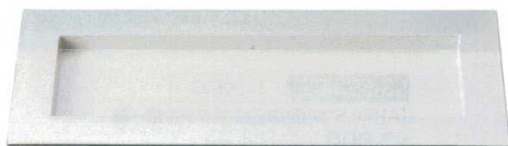
3-553-03 1200039 【A】尺1寸つば付長角皿 銀透き裏黒塗 ¥3,100 328×136×H20 幅100