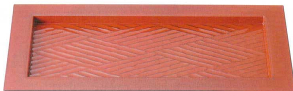
3-553-08 1200068 【A】尺2.5寸つば付長角皿 根来 ¥4,000 380×200×H21 幅60