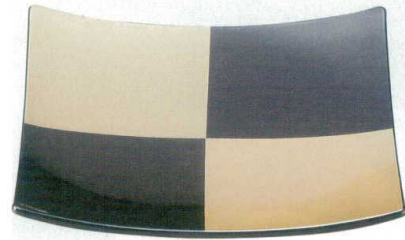
[M] きさらぎ皿 黒金市松