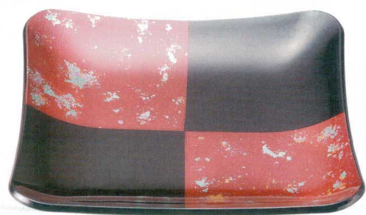
3-567-11 1200193 [M] 尺1寸金剛皿 黒紫箔ちらし市松 ¥10,700 319×319×H43 梱20