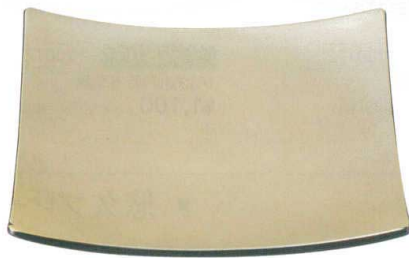
[M] きさらぎ皿 銀透き裏黒塗