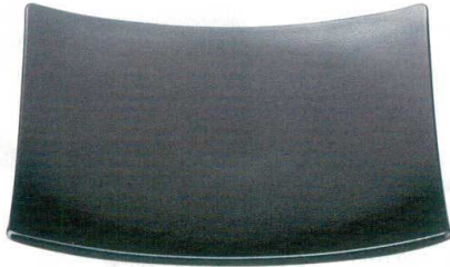
[M] きさらぎ皿 黒石目