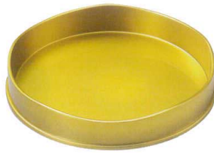
【木質】耐熱風月盛器 黄金裏黒塗 3-607-07 1200635 (小) ¥3,350 φ160×H31 櫃80 3-607-08 1200636 (大) ¥4,250 φ185×H36 櫃60