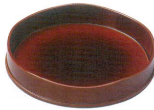
【木質】耐熱風月盛器 漆風春慶裏黒塗 3-607-03 1200631 (小) ¥2,800 φ160×H31 櫃80 3-607-04 1200632 (大) ¥3,700 φ185×H36 櫃60