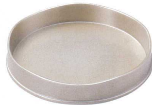
【木質】耐熱風月盛器 銀透き裏黒塗 3-607-09 1200637 (小) ¥4,800 φ160×H31 櫃80 3-607-10 1200638 (大) ¥5,950 φ185×H36 櫃60