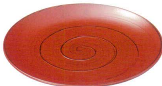
【木質】耐熱万葉皿 総一筆根来 3-607-11 1200639 5寸 ¥1,950 φ150×H15 櫃200 3-607-12 1200640 6寸 ¥2,300 φ180×H16 櫃150 3-607-13 1200641 7寸 ¥3,100 φ213×H16 櫃100