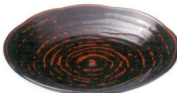
3-607-20 1400035 【A】飛騨そば皿 曙 ¥2,000 245×228×H33 櫃100