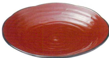
3-607-19 1200647 【A】飛騨そば皿 銀朱天黒 ¥1,100 245×228×H33 櫃100