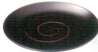
【木質】耐熱万葉皿 総一筆曙 3-607-14 1200642 5寸 ¥1,950 φ150×H15 櫃200 3-607-15 1200643 6寸 ¥2,300 φ180×H16 櫃150 3-607-16 1200644 7寸 ¥3,100 φ213×H16 櫃100