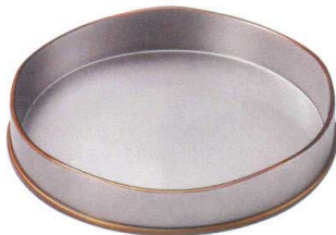
【木質】耐熱風月盛器 銀透き測天べっ甲裏黒塗 3-607-05 1200633 (小) ¥3,100 φ160×H31 櫃80 3-607-06 1200634 (大) ¥3,950 φ185×H36 櫃60