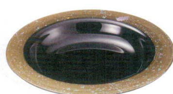
3-607-21 1200648 【TA】耐熱測付丸皿 黒測金箔ちらし ¥1,750 φ238×H31 櫃80