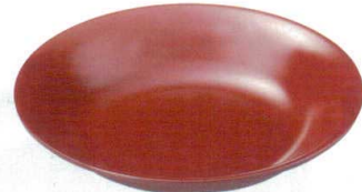
【A】桔梗皿 総銀朱 3-607-17 1200645 5寸 ¥750 φ150×H32 櫃150 3-607-18 1200646 7寸 ¥1,050 φ211×H40 櫃100