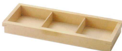
3-619-11 1200857 【木】白木3ツ仕切り盛器 ¥5,100 385×145×H49 櫃40