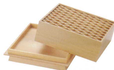
3-619-13 1200856 【木】白木蓋付盛器 ¥18,000 246×246×H120 櫃20