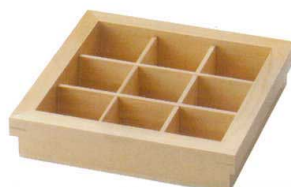
3-619-12 1200855 【木】白木9ツ仕切り盛器 ¥7,100 240×240×H50 櫃30