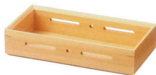
3-619-03 1204180 【木】白木8寸長角盛箱 ¥5,250 240×120×H50 櫃30