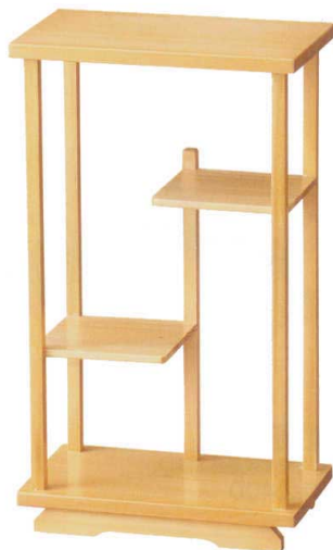
3-619-01 1204178 【木】白木とまり木 ¥7,700 170×100×H300 櫃20