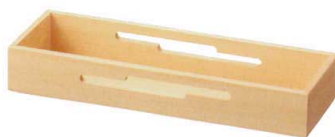
3-619-04 1204181 【木】白木9寸長角盛箱 ¥5,600 280×90×H45 櫃40