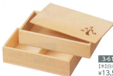
3-619-02 1204179 【木】白木長手2段弁当 松 ¥13,500 255×136×H111 櫃20