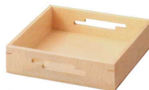
【木】桃山盛箱 3-619-05 1204182 (小) ¥5,000 183×183×H46 櫃50 3-619-06 1204183 (中) ¥5,500 213×213×H46 櫃40 3-619-07 1204184 (大) ¥6,400 243×243×H46 櫃30