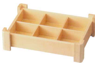
3-619-09 1204186 【木】白木6点盛箱 ¥9,350 280×200×H70 櫃30