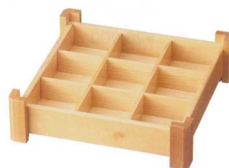
3-619-10 1204187 【木】白木9点盛箱 ¥10,500 280×280×H70 櫃20