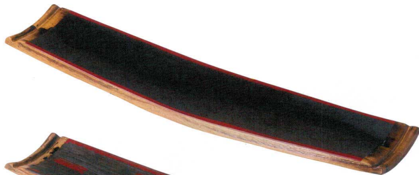
3-626-01 1200897 【木】樽盛器 1号 黒/朱 ¥132,000 880×180×H65 梱2