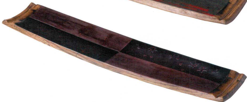
3-626-03 1200899 【木】樽盛器 1号 春秋市松 ¥117,500 880×180×H65 梱2