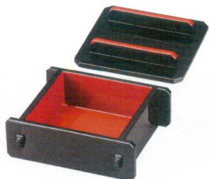
3-693-11 1400049 【A】(小)蓋付セイロ(底有) 黒内天朱 蓋 ¥850 111×111×H23 梱100