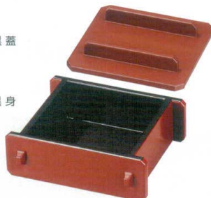
3-693-20 1400055 【A】(大)蓋付セイロ(底有) 銀朱内黒 蓋 ¥1,500 130×130×H25 梱100