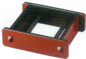
3-693-03 1400045 【A】DXツノセイロ(底無) 銀朱天黒 ¥2,300 171×151×H53 梱60