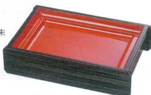
3-693-25 1400424 【A】干筋長角セイロ(底有) 黒内朱 ¥1,750 218×143×H57 梱60