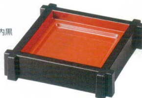
3-693-09 1400048 【A】井桁そば皿(底有) 黒内朱 ¥1,100 160×160×H43 梱60