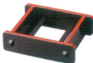
3-693-01 1400044 【A】DXツノセイロ(底無) 黒天朱 ¥1,950 171×151×H53 梱60