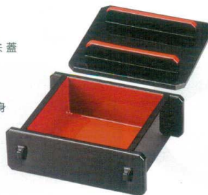
3-693-14 1400053 【A】(大)蓋付セイロ(底有) 黒内天朱 蓋 ¥1,300 130×130×H25 梱100