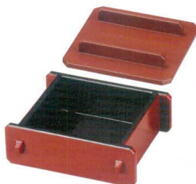
3-693-17 1400051 【A】(小)蓋付セイロ(底有) 銀朱内黒 蓋 ¥1,100 111×111×H23 梱100