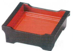
3-693-23 1400057 【A】(小)御殿型セイロ(底有) 黒内朱 ¥1,350 145×130×H53 梱80