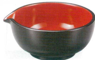
3-705-15 1400196 【木質】耐熱4.1寸片口鉢 黒内朱 ¥1,500 135×124×H59 梱100