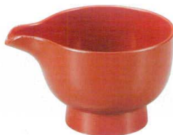
3-705-13 1400194 【M】2.6寸片口鉢 朱 ¥990 100×80×H60 梱150