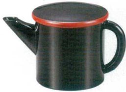
3-705-01 1400182 【A】ミニ丸ゆとう 黒淵朱 ¥1,430 φ75×H80 梱160

[TA] [木質] [PET] [PBT] [PC] [TR] [メラミン] [CE] マークは 洗浄機対応