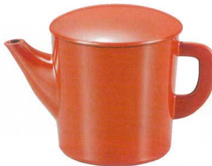
3-705-05 1400186 【A.M】(小)丸ゆとう 朱 ¥2,000 φ90×H95 梱100