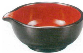
3-705-14 1400195 【木質】耐熱3.4寸片口鉢 黒内朱 ¥1,300 118×103×H49 梱100