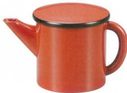
3-705-04 1400185 【A】ミニ丸ゆとう 朱淵黒 ¥1,430 φ75×H80 梱160