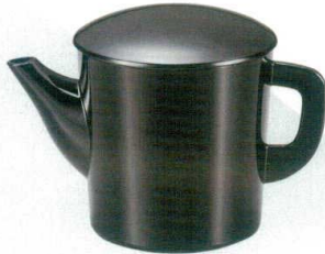
3-705-02 1400183 【A.M】(小)丸ゆとう 黒 ¥2,000 φ90×H95 梱100