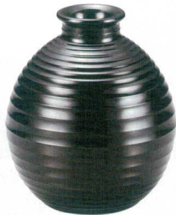
【A】とっくりダシ入れ 黒 3-705-07 1400188 (小) ¥680 φ70×H75 梱100 3-705-08 1400189 (中) ¥1,050 φ100×H115 梱80 3-705-09 1400190 (大) ¥1,250 φ115×H140 梱60