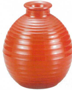
【A】とっくりダシ入れ 朱 3-705-10 1400191 (小) ¥680 φ70×H75 梱100 3-705-11 1400192 (中) ¥1,050 φ100×H115 梱80 3-705-12 1400193 (大) ¥1,250 φ115×H140 梱60