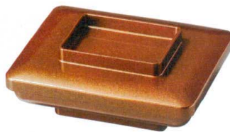
3-718-08 1400278 【A】(小)うなぎ平 梨地内朱 ¥2,500 164×126×H62 梱60