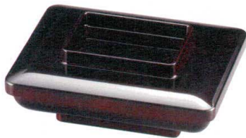
3-718-06 1400276 【A】(小)うなぎ平 溜内朱 ¥2,500 164×126×H62 梱60