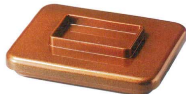
3-718-09 1400279 【A】(大)うなぎ平 梨地内朱 ¥2,650 188×139×H58 梱60