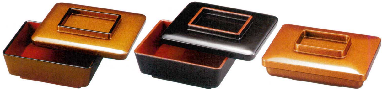
3-718-01 1400271 【A】D.X深型并重 梨地天黒内朱 ¥3,100 187×153×H80 梱50