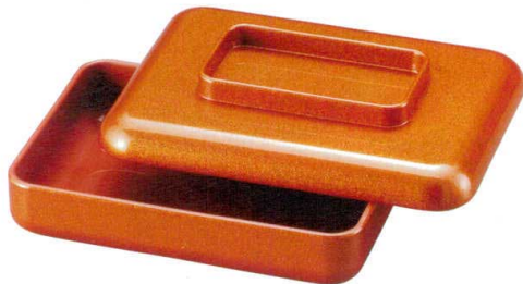
3-718-04 1400274 【A】錦うなぎ平 梨地内朱 ¥1,800 169×126×H58 梱60