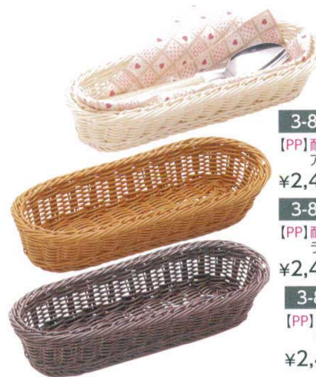
3-800-19 1500848 【PP】耐熱小判型樹脂バスケット アイボリー ¥2,450 270×102×H51 幅60