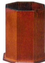
3-800-06 1500841 【木】箸立て ブラウン ¥3,500 106×106×H147 幅80