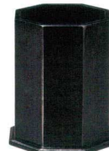
3-800-07 1500842 【木】箸立て 黒 ¥3,400 106×106×H147 幅80