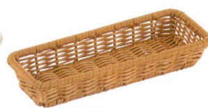
3-800-15 1500844 【PP】耐熱長角型樹脂バスケット ライトブラウン ¥2,100 266×101×H45 幅60