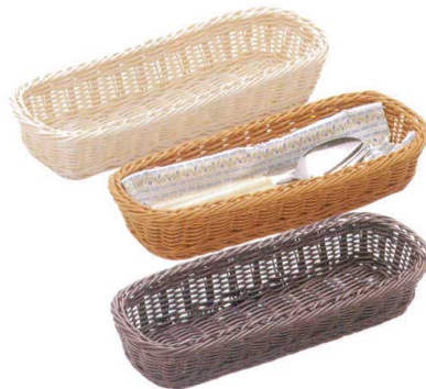
3-800-16 1500845 【PP】耐熱胴張型樹脂バスケット アイボリー ¥2,450 271×101×H50 幅60