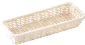
3-800-14 1500843 【PP】耐熱長角型樹脂バスケット アイボリー ¥2,100 266×101×H45 幅60