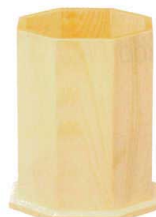
3-800-05 1500840 【木】箸立て 白木 ¥4,000 106×106×H147 幅80