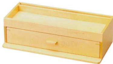
3-800-04 1500829 【木】24.4cmメニュー立て・カスター付箸箱 白木 ¥15,000 270×132×H81 幅40