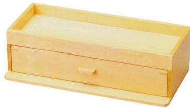
3-800-01 1500826 【木】24.4cmカスター付箸箱 白木 ¥14,000 270×132×H81 幅40