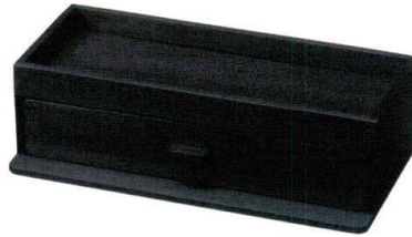
3-800-02 1500828 【木】24.4cmカスター付箸箱 黒 ¥13,500 270×132×H81 幅40