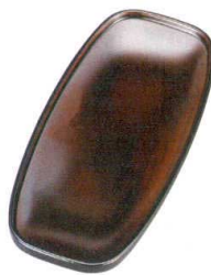
3-812-05 1500944 【A】網張おしぼり受け 栃かすり ¥750 172×82×H13 梱200