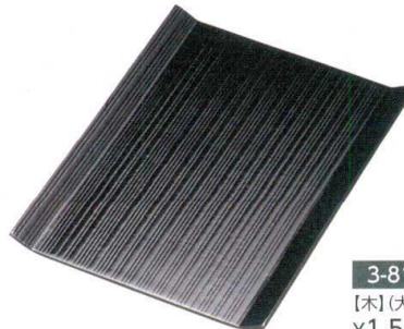
3-812-13 1500950 【木】(大)木製干筋おしぼり受け 黒 ¥1,550 190×145×H13 梱200