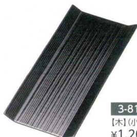
3-812-12 1500949 【木】(小)木製干筋おしぼり受け 黒 ¥1,200 190×87×H13 梱200