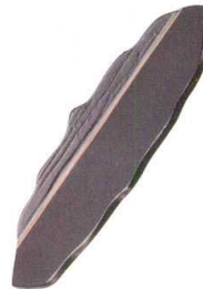
3-812-08 1501580 【木】木製変形おしぼり受け 溜金ライン ¥3,200 200×80×H15 梱200