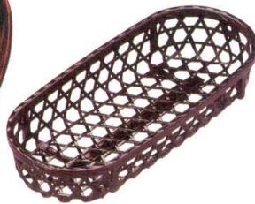
3-812-07 1200461 【A】8.5寸長手竹かご 本体 溜 ¥1,200 248×110×H44 梱60