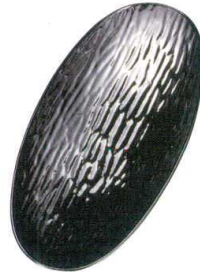
3-812-03 1500942 【A】ノミ彫りおしぼり受け 黒 ¥350 192×85×H17 梱200