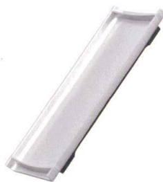
3-812-02 1501579 【A】竹型おしぼり受け 銀 ¥950 200×82×H17 梱200