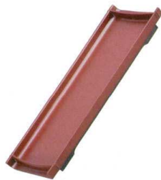
3-812-01 1501578 【A】竹型おしぼり受け 銀朱 ¥600 200×82×H17 梱200