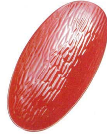
3-812-04 1500943 【A】ノミ彫りおしぼり受け 朱 ¥350 192×85×H17 梱200