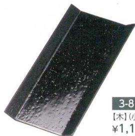
3-812-10 1500947 【木】(小)木製おしぼり受け 黒 ¥1,100 188×88×H11 梱200