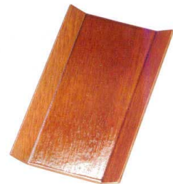
3-812-09 1500946 【木】木製おしぼり受け ケヤキ ¥1,000 180×77×H14 梱200