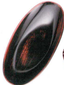
3-812-06 1500945 【木質】耐熱小判おしぼり受け 曙 ¥1,300 203×86×H21 梱200