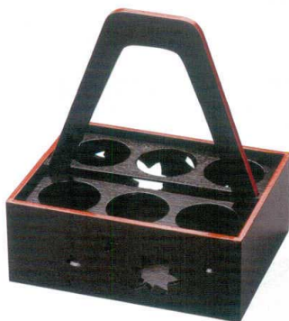
3-813-02 1500952 【木】木製6本用スタックビール運び 黒天朱 ¥16,000 314×243×H353 梱5