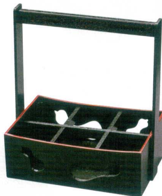
3-813-03 1500953 【木】木製6本用ビール運び グリーン天朱 ¥9,700 330×230×H370 梱4