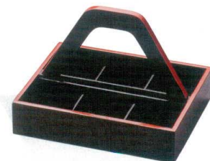
3-813-07 1500957 【木】木製コップ運び 黒天朱 ¥14,700 277×219×H20 梱8