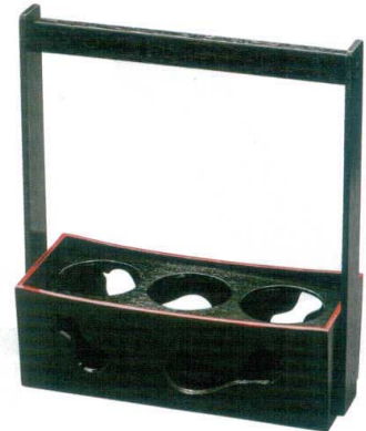
3-813-01 1500951 【木】木製3本用ビール運び グリーン天朱 ¥8,000 320×130×H370 梱10