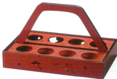
3-813-05 1500955 【木】木製8本用銚子運び 朱天黒 ¥15,500 394×243×H220 梱6