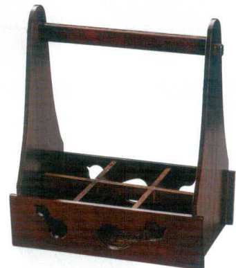
3-813-04 1500954 【木】木製6本用ケヤキビール運び ¥19,000 318×210×H373 梱4