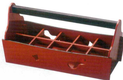
3-813-06 1500956 【木】木製10本用銚子運び 朱天黒 ¥9,250 415×172×H200 梱6