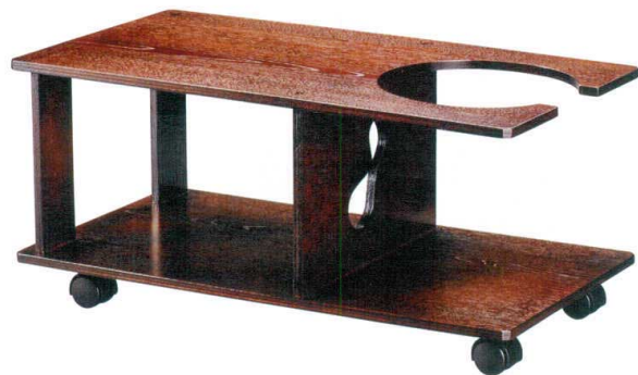
3-814-14 1500971 【木】木製ポットワゴン ケヤキ ¥41,000 635×350×H310 梱3