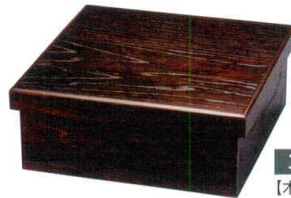
3-814-11 1500969 【木】木製茶びつ ケヤキ ¥15,000 320×320×H123 梱10