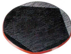
3-814-03 1500960 【木】木製菓子皿(小) 黒天朱 ¥1,650 φ140×H14 梱60