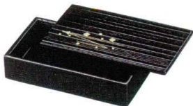
3-814-01 1500958 【木】木製楊枝入れ 黒松葉 ¥2,350 104×61×H26 梱60