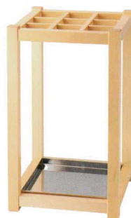
3-814-15 1501581 【木】木製かさ立て 白木 ¥48,000 300×300×H500 梱1