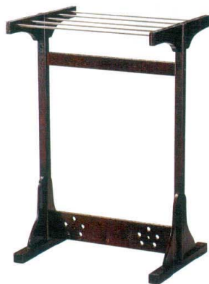
3-814-13 1500968 【木】木製タオル掛け ケヤキ ¥25,000 390×325×H600 梱4