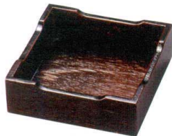
3-814-05 1500962 【木】木製灰皿枠 ケヤキ ¥2,000 120×120×H40 梱40