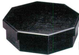
3-814-12 1500970 【木】木製八角茶びつ 黒 ¥10,500 308×335×H95 梱10