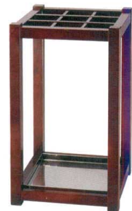
3-814-16 1501582 【木】木製かさ立て ブラウン ¥49,000 300×300×H500 梱1