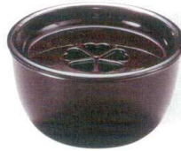
3-815-02 1500973 【A】茶こぼし 溜パール(内黒) ¥830 φ122×H67 櫃60