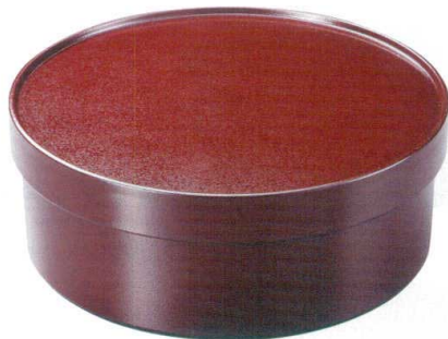
3-815-04 1500975 【A】尺1寸兼六茶びつ 茶石目(内黒) ¥7,000 φ326×H127 櫃10