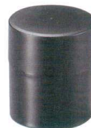
3-815-13 1500984 【A】切立茶筒(小)(中蓋付) つや消し黒(内黒) ¥650 φ73×H86 櫃60