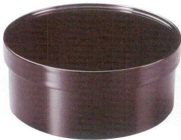
3-815-01 1500972 【A】9寸兼六茶びつ 溜パール(内黒) ¥4,200 φ270×H117 櫃10