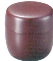
3-815-10 1500980 【A】茶筒(中蓋付) 茶乾漆(内黒) ¥1,050 φ87×H90 櫃60