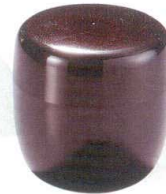
3-815-03 1500974 【A】茶筒(中蓋付) 溜パール(内黒) ¥1,000 φ87×H90 櫃60