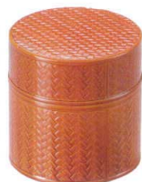
3-815-11 1500982 【M】のみ影茶筒 春慶(内黒) ¥1,900 φ90×H93 櫃60