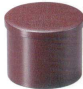
3-815-05 1500976 【A】兼六茶こし 茶乾漆(内黒) ¥1,000 φ84×H68 櫃60