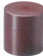
3-815-06 1500977 【A】兼六茶筒(小)(中蓋付) 茶乾漆(内黒) ¥1,350 φ88×H93 櫃60