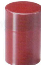
3-815-14 1500985 【A】切立茶筒(中)(中蓋付) マロン(内黒) ¥700 φ73×H111 櫃60