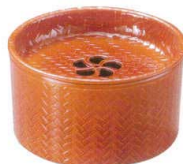
3-815-12 1500983 【M】のみ影茶こぼし 春慶(内黒) ¥1,750 φ119×H67 櫃60