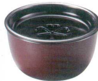
3-815-09 1500979 【A】茶こぼし 茶乾漆(内黒) ¥830 φ122×H67 櫃60