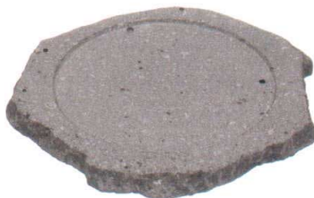
3-841-08 1600801 【石】熔岩プレート (中) ¥20,000 φ165×H15 内径φ125 梱25