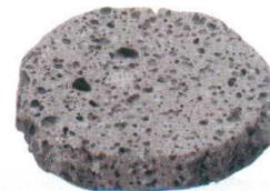
3-841-06 1600799 【石】料理石 隅丸 (小) ¥9,600 100×100×H18 梱35