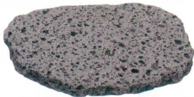
3-841-04 1600797 【石】料理石 自然風 ¥15,500 190×140×H18 梱25