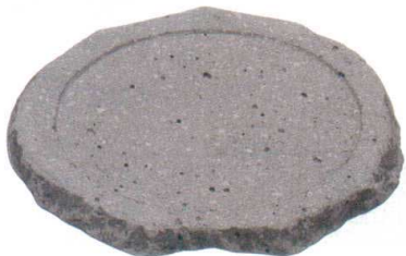
3-841-07 1600800 【石】熔岩プレート (大) ¥26,500 φ190×H15 内径φ145 梱20