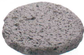
3-841-05 1600798 【石】料理石 隅丸 (大) ¥12,000 120×120×H18 梱30