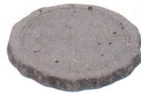
3-841-09 1600802 【石】熔岩プレート (小) ¥17,500 φ145×H15 内径φ115 梱30