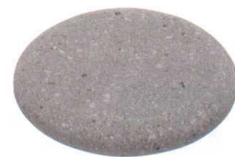
3-841-11 1600804 【石】料理石 丸形 ¥14,500 φ130×H25 梱30