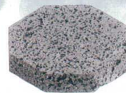
3-841-03 1600796 【石】料理石 (小) ¥7,250 90×90×H18 梱40