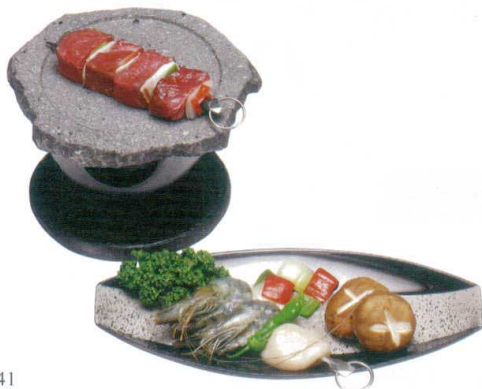
3-841-10 1600803 【石】熔岩プレート 長角 ¥16,500 170×140×H15 (内径145×115) 梱20